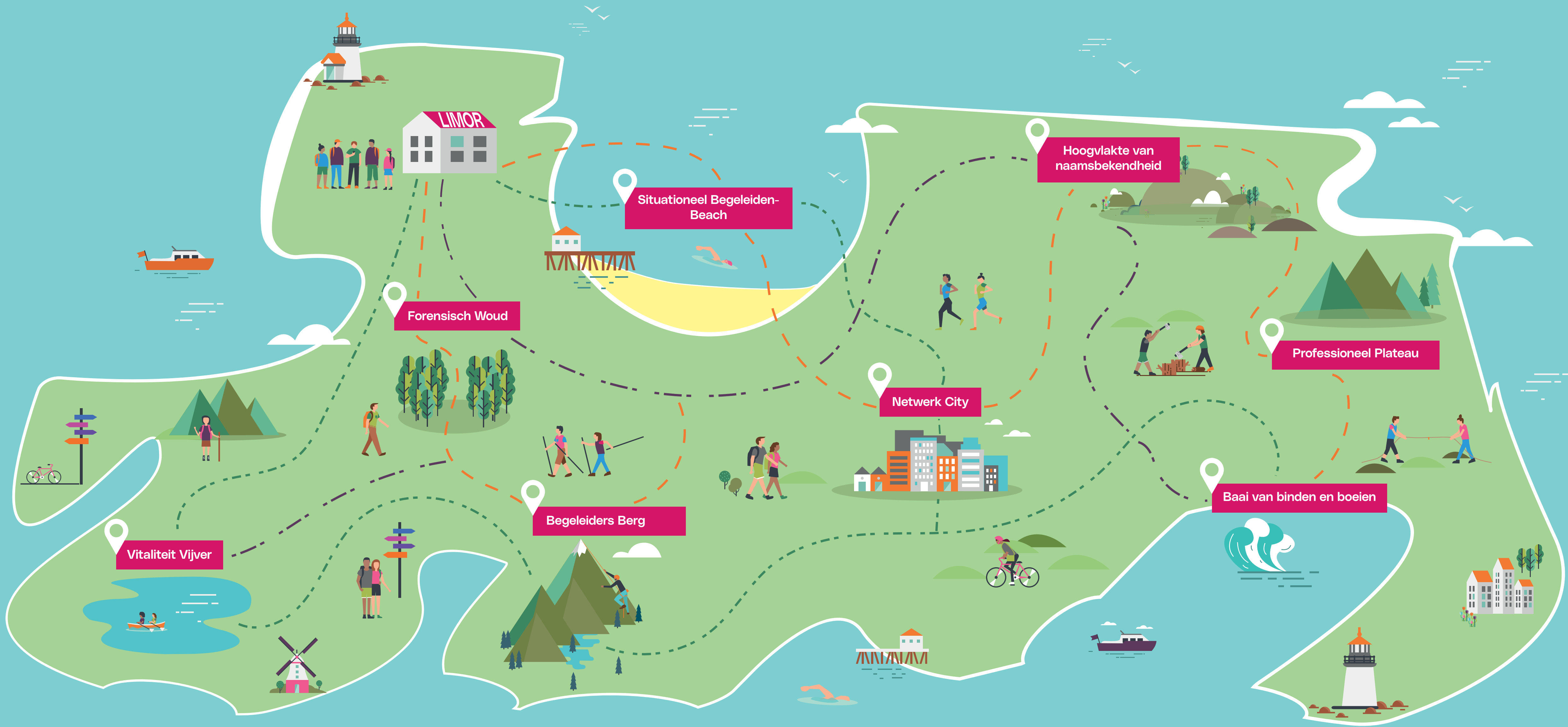
Routekaart strategische koers